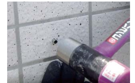
③アンカーピン固定