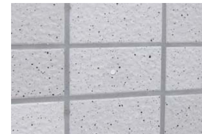
⑤化粧キャップ取付→完了